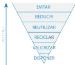
Figura 1. Pirámide invertida

La economía circular es una herramienta eficiente para avanzar hacia el desarrollo sostenible, ya que propone el rediseño de sistemas, productos y procesos con el objetivo de optimizar recursos y minimizar la generación de residuos. La siguiente figura expone el orden prioritario de las acciones a impulsar para una GIRSU desde el enfoque de la economía circular: