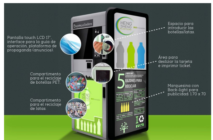
Figura 4. Posible modelo de máquina de recolección de PET

El objetivo de esta iniciativa es concientizar a la comunidad acerca de la importancia del reciclaje y contribuir a un mayor recupero de PET. Esta iniciativa se enfoca en el eje reciclaje de la pirámide.